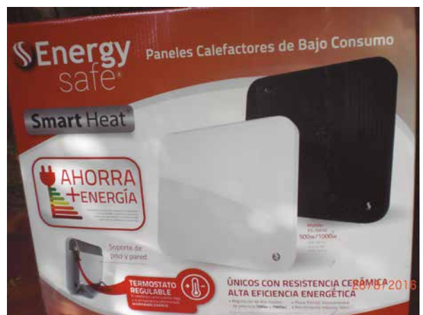
Figura 1. Estufa a resistencias presentada como “de bajo consumo”

Pero ahora resulta que, cuando vamos a reemplazar el “toma” dañado por recalentamiento, nos encontramos con una instalación que por su antigüedad carece de conductor de puesta equi-