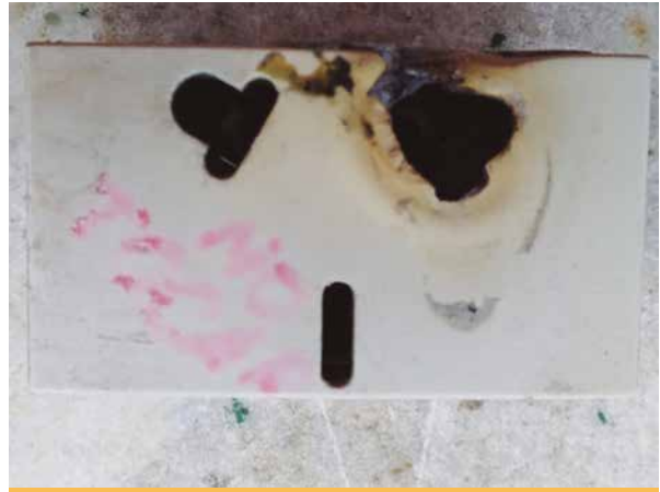
Figura 3. "Toma" binorma recalentado.

potencial, lo que nos plantea las siguientes opciones: