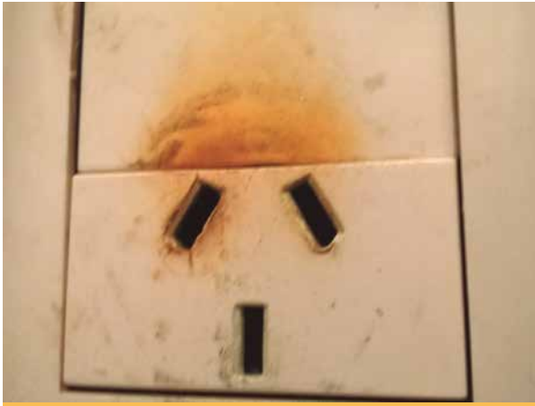
Figura 2. "Toma" reglamentario recalentado por sobrecarga y/o falso contacto, frecuentemente producido por insuficiente introducción de la ficha.