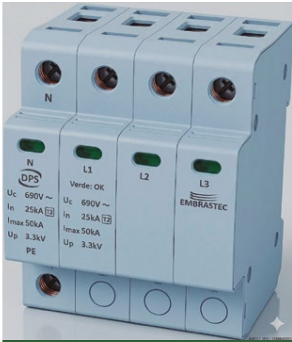
Figura 1. DPS

más cerca posible de la acometida en baja tensión, lo que permite interceptar y desviar la energía de las descargas atmosféricas directas antes de que alcancen el interior de la instalación.