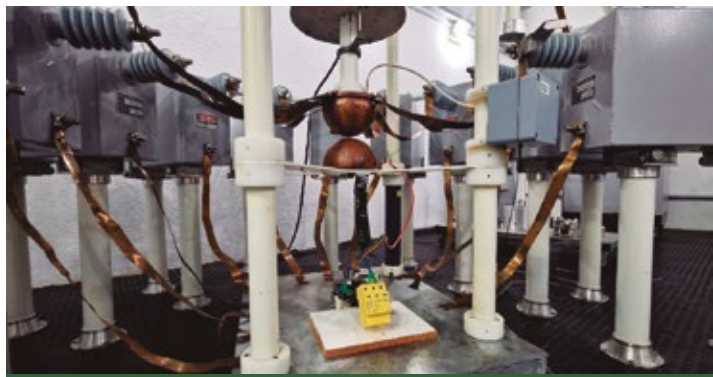
Figura 3. Laboratorio de alta tensión de Embrastec

Esta etapa del proceso también puede incluir visitas y auditorías a dichos proveedores