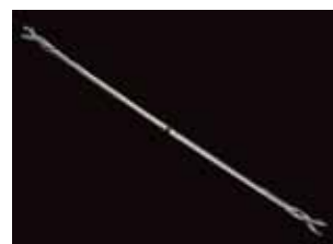
Camisa de acero para protección de fibra óptica ADSS