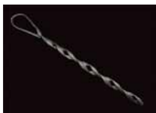
Retención de acero para fibra óptica ADSS

La fabricación y comercialización de equipos se complementa con el respeto por los plazos de entrega, en donde la empresa afirma hacer hincapié, y en la posibilidad de brindar planes de financiación para las cooperativas eléctricas. ■