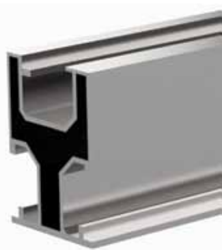
Uno de los perfiles de aluminio disponibles para paneles solares

La fuerte impronta online que tiene la empresa, sin embargo, no va en desmedro de una atención personalizada. Internet es la herramienta de la que se vale para agilizar todos los procesos que, gracias a la tecnología, pueden ser más eficientes, como el de compra, atención de consultas, o programación de envíos. Pero cada cliente que contacta a la empresa, es atendido de forma particularizada, es escuchado, y se buscan para él las mejores soluciones a los problemas y necesidades que plantea. Más de 5.000 clientes contentos y satisfechos lo avalan. ■