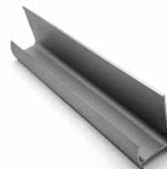
Uno de los perfiles de aluminio disponibles para muebles