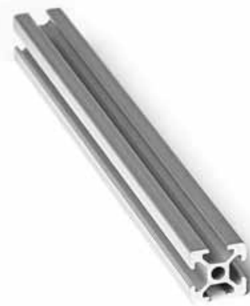
Uno de los perfiles de aluminio disponibles para estructuras de maquinarias