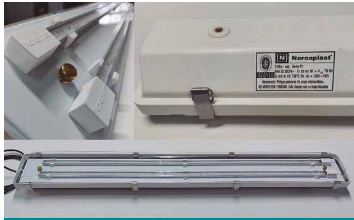
712Ex-LED, luminaria led para atmósferas explosivas