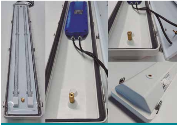
712Ex-LED, equipamiento electrónico, con modo de protección antideflagrante, encapsulado y con protección por envoltura

eléctricos y, como tal, posibles fuentes de chispa y explosión.