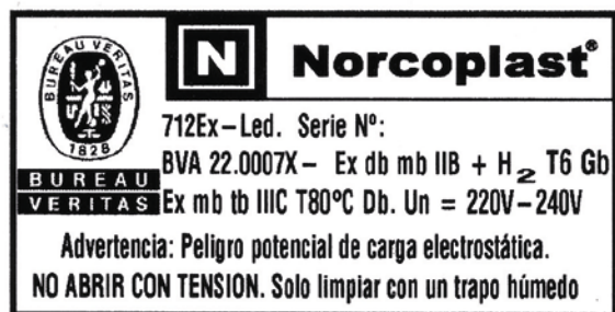
Placa de marcado del equipo