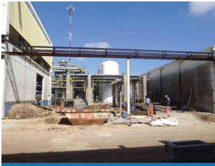
Personal de Á. Reyna & Asoc. realizando este tipo de procedimientos en una industria electroquímica.

Este valor se puede comprobar mediante la medición de la resistencia eléctrica de la armadura metálica entre la parte superior de dicha columna y su parte más baja a nivel de suelo o subsuelo, tal como se ilustra en la figura 1. La corriente inyectada debe ser de aproximadamente 10 A.