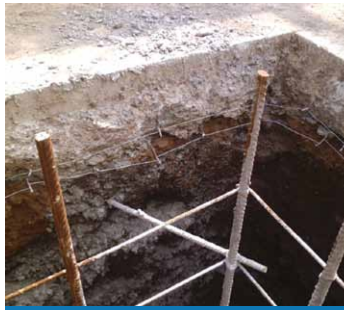
Armaduras de bases de hormigón armado (tomadas de tierra de cimientos).