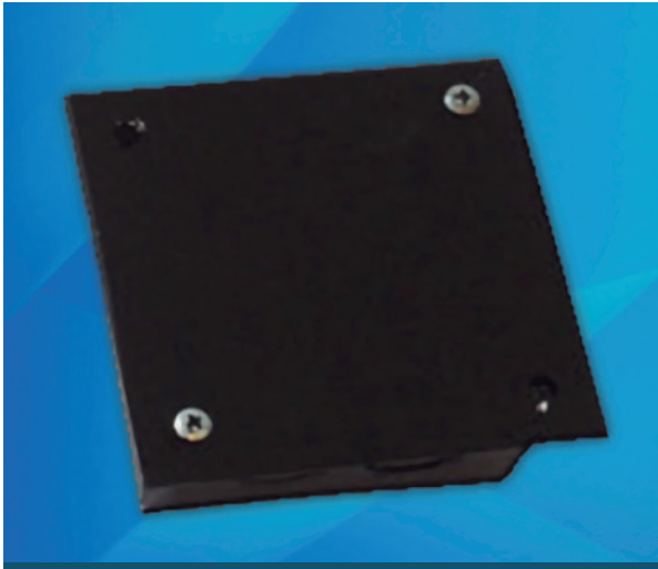
Cajas de pase