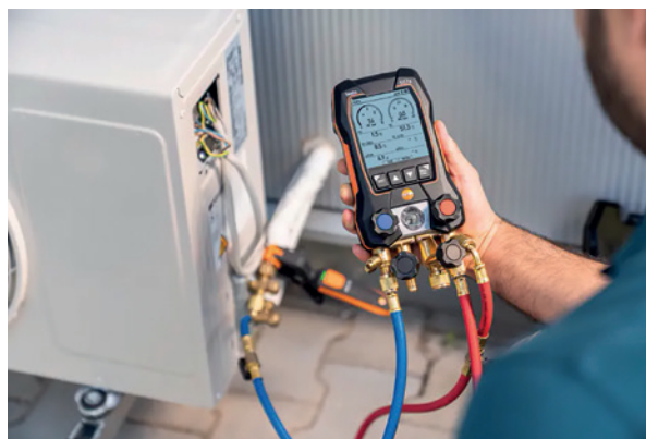
Analizadores digitales de refrigeración

El análisis de temperatura es una herramienta que colabora con la detección temprana de desperfectos en los aparatos eléctricos o en cualquier instalación donde, por ejemplo, un sobrecalentamiento atendido a tiempo evite problemas de mayor envergadura.