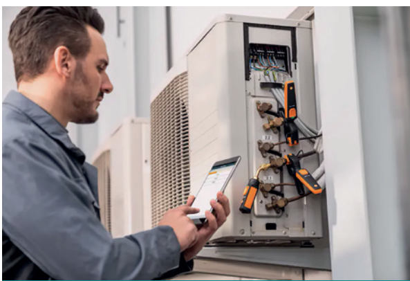
Smart Probes

Junto a los analizadores, están disponi- bles las sondas inteligentes para medir la temperatura, la presión, la humedad y la velocidad del aire