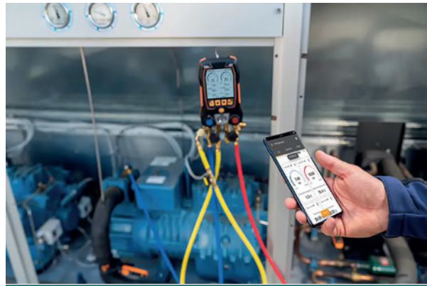
Analizador digital de refrigeración testo 570s

Asimismo, la aplicación testo Smart permite controlar las mediciones de manera cómoda y fácil desde cualquier teléfono inteligente, incluyendo la configuración, medición, gestión de datos y envío de informes, con menús de medición intuitivos, documentación sencilla y envío de protocolos de medición en PDF o Excel.