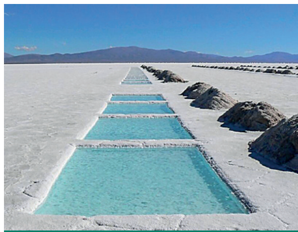
Figura 2. El proceso para hacer una batería requiere de salares con recursos probados.

Cuando una batería de litio está cargada significa que el litio se desprendió de su electrón externo y quedó cargado positivamente, y así pasa a denominarse “ion de litio”, motivo por el cual luego se conoce a las baterías como “de ion-litio”. Se calcula que cada vehículo eléctrico lleva entre treinta y sesenta kilos de carbonato de litio en su batería. El litio para la batería argentina proviene de salares catamarqueños de Fiambalá. Al mismo tiempo, YPF Litio inició una exploración propia en Fiambalá Norte, junto a Catamarca Minera y Energética Sociedad del Estado (CAMYEN).