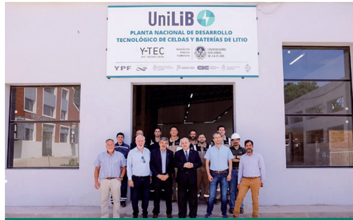
Figura 1. UniLiB, la primera Planta Nacional de Desarrollo Tecnológico de Celdas y Baterías de Litio, creada por la Universidad Nacional de La Plata (UNLP) e Y-TEC, la empresa de tecnología de YPF y el CONICET.

En diciembre de 2022 la noticia era: “Llegaron las máquinas para la primera planta argentina de desarrollo de baterías de litio”. En mayo de este 2023 comenzaron a instalarse los equipos, y en breve comenzará a operar UniLiB, la primera Planta Nacional de Desarrollo Tecnológico de Celdas y Baterías de Litio, creada por la Universidad Nacional de La Plata (UNLP) e Y-TEC, la empresa de tecnología de YPF y el CONICET. Se trata de setenta máquinas provenientes de China, que incluyen mezcladoras, hornos, cicladores, corte y apilamiento, deshumidificadores, y dos importantes prensas de 13.000 kilogramos cada una.