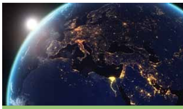
Figura 2. Las luces en la superficie son activos conectados al ecosistema de la red

Consideremos un ejemplo hipotético usando energía solar. Los prosumidores podrían instalar medidores con sensores y tecnología inteligentes. Estos medidores inteligentes miden la energía de la red solar y envían información sobre la producción de energía, el consumo y el exceso de energía a una aplicación móvil. El prosumidor informado, luego, vende el excedente al mercado de consumo a través de una plataforma de comercio en línea. La transacción sería totalmente automática basada en contratos inteligentes, y una red basada en una cadena de bloques registrará las ventas. La red eléctrica (asistida, quizás, por empresas distribuidoras de energía eléctrica progresistas) entrega la energía comprada a los consumidores u otros prosumidores. Usando blockchain, es posible imaginar una red de energía descentralizada que facilite la producción,