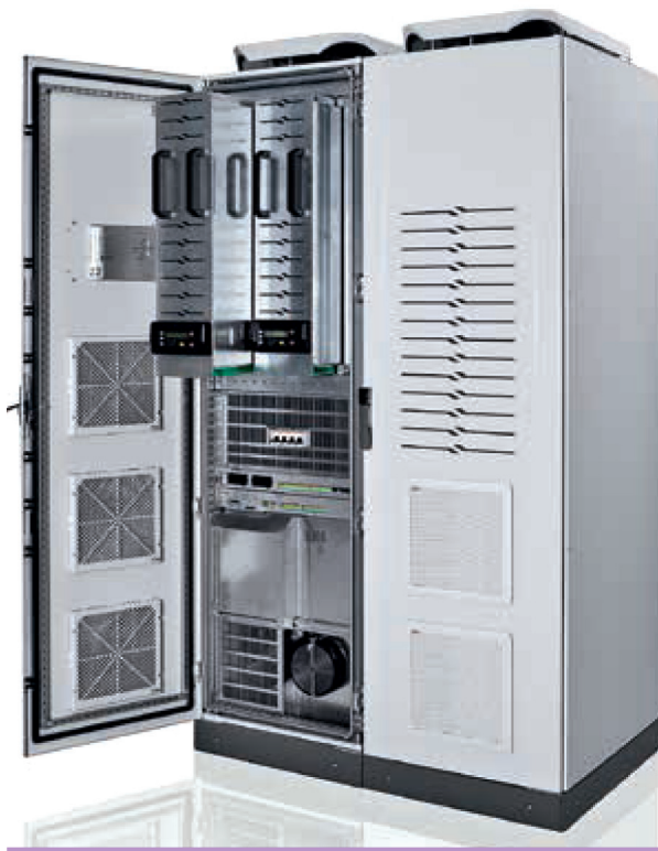
Imagen 2. PowerLine DPA, de ABB

UPS PowerLine DPA es la última incorporación a esta gama (ver imágenes 2 y 3).